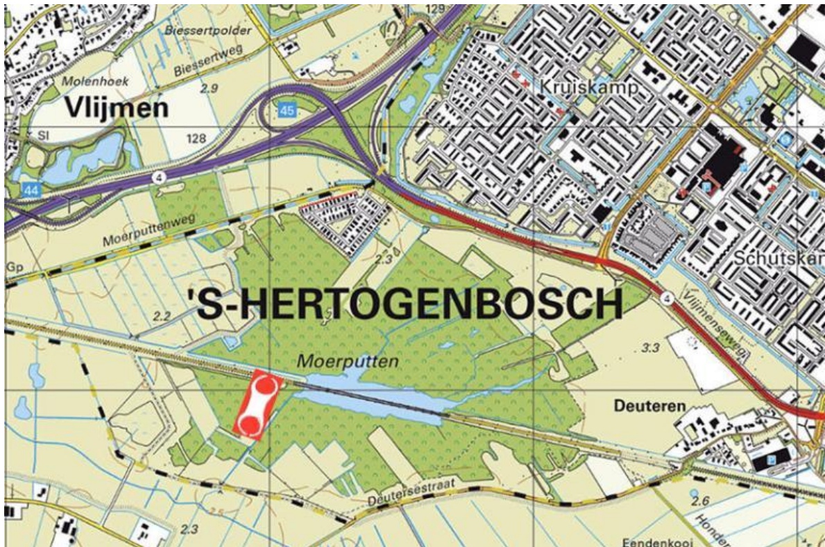
Topografische atlas Noord Brabant bewerkt door Jan Taat