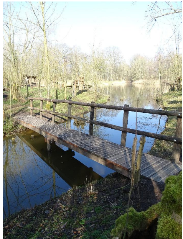
Nieuwe brug over pijp 4