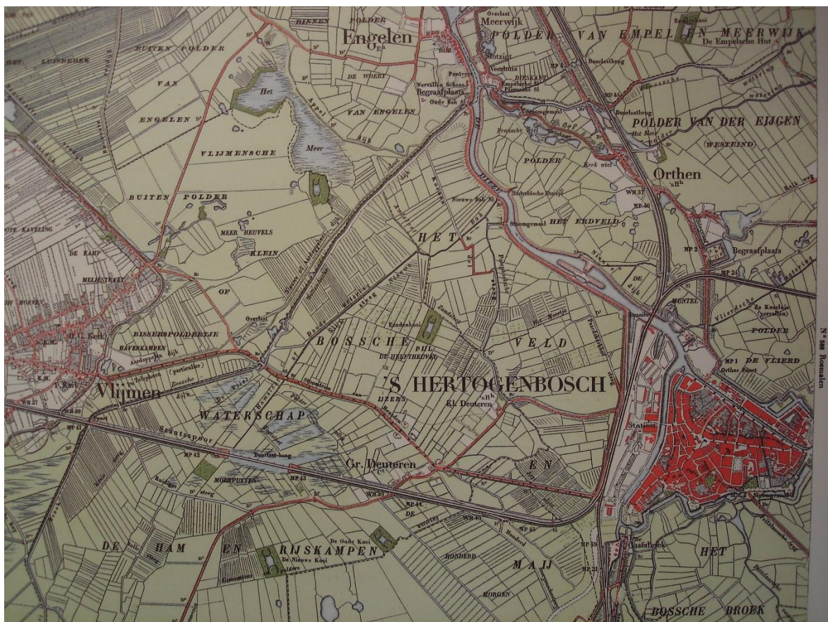
Historische atlas Noord Brabant