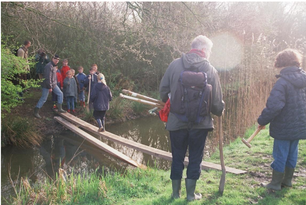
Nog een foto van voor de draaibruggen

Als de tweede draaibare brug klaar is, kan bij excursies en bezoekersgroepen een wandeling rond de hele vijver/kooi worden gemaakt.