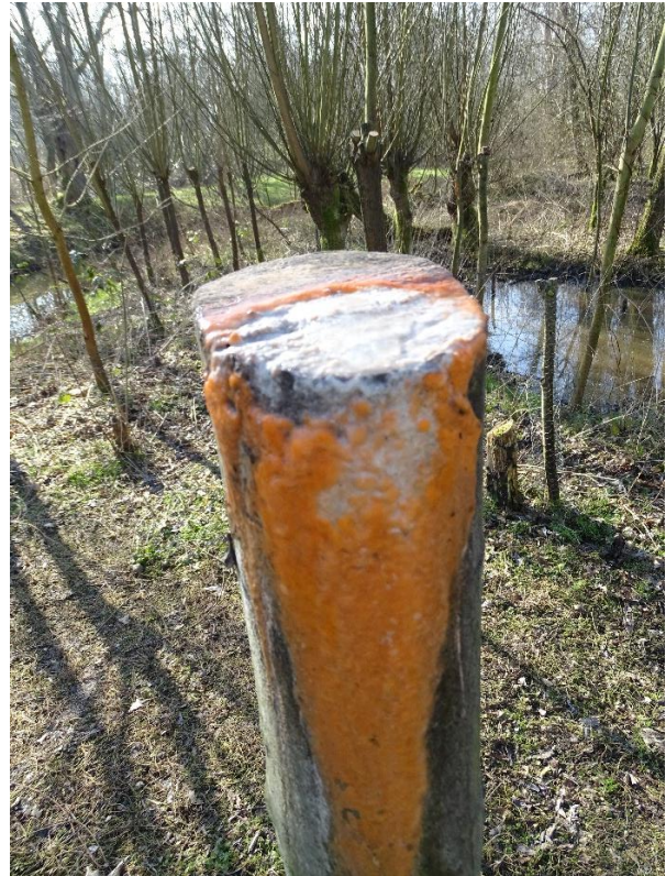
Foto van een na 1 januari geknotte nu bloedende esdoorn

Inmiddels is er een instructiekaart knotten gemaakt.