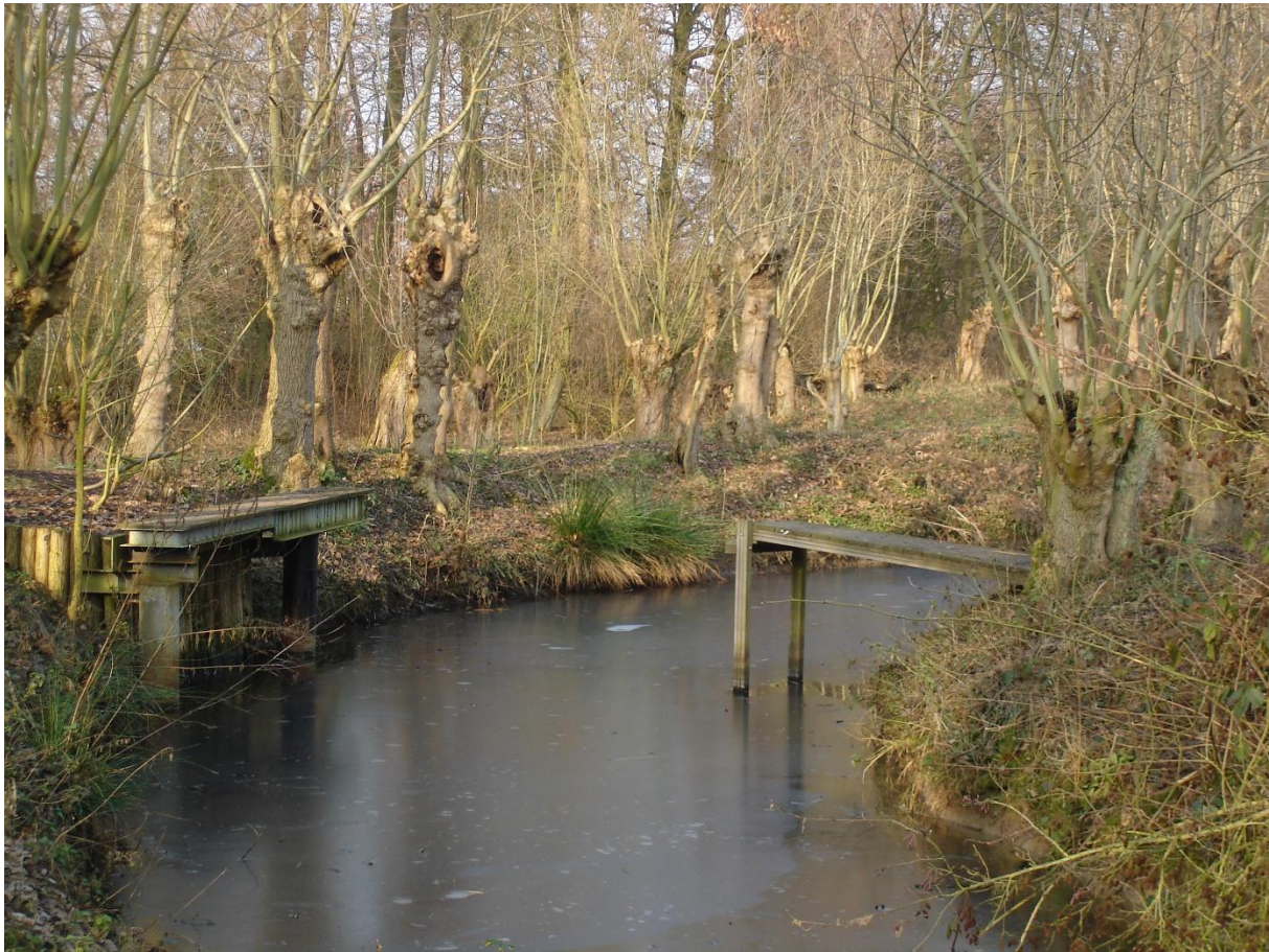
2 e Draaibrug

Op onderstaande foto is duidelijk te zien dat ook de 2 e brug eigenlijk een draaibrug is. Dit was een eis van de gemeente omdat de brug weggedraaid zou moeten kunnen worden als er een maaiboot in de Eendenkooi zou komen. Er is nog nooit een maaiboot in de Eendenkooi geweest.